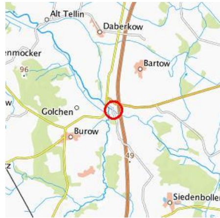
Foto-Vorschau Pegel 04 815.1

Jahreswasserstände in Prozent des langjährigen Mittelwertes